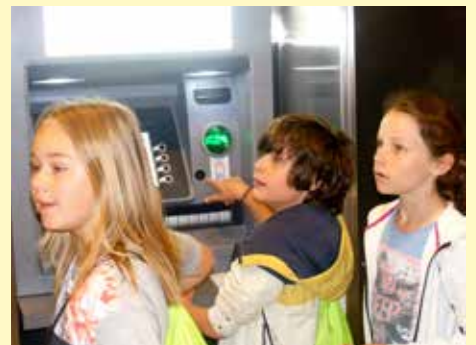
RONDJE RABO RENNEN

Vrijwilligers Stichting Roefeldag Oirschot